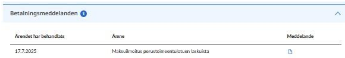
Bild 5. Exempel på uppgifter i dragspelsmenyn Betalningsmeddelanden.