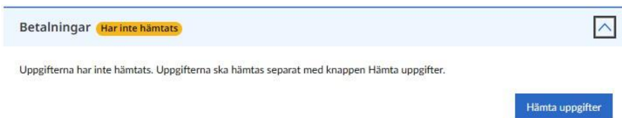
Bild 6. Menyn Betalningar i användargränssnittet.

De uppgifter som visas i menyn Betalningar ska tills vidare hämtas separat genom att klicka på knappen Hämta uppgifter.