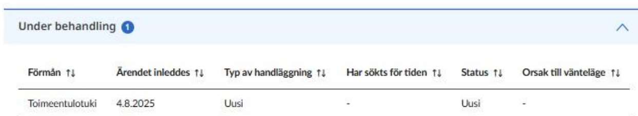
Bild 2. Exempel på uppgifter i dragspelsmenyn Under behandling.

I menyn Under behandling visas uppgifter om handläggningen av ansökan om grundläggande utkomststöd. Uppgifterna kan omfatta datum när ärendet inleddes, tidsperiod för vilken förmånen söks, handläggningsstatus och orsak till vänteläge. Alla öppna ärenden som ansluter till grundläggande utkomststöd visas inte i Kelmu. Orsaken till vänteläge visas om tilläggsinformation har begärts och handläggningen väntar på svar. En ansökan kan vara i vänteläge av flera olika orsaker samtidigt, och då visas bara en av orsakerna.